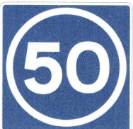
J09.xx Leiðbeinandi hámarkshraði

17. gr. breytist þannig að við bætist nýtt undirmerki sem hér segir: